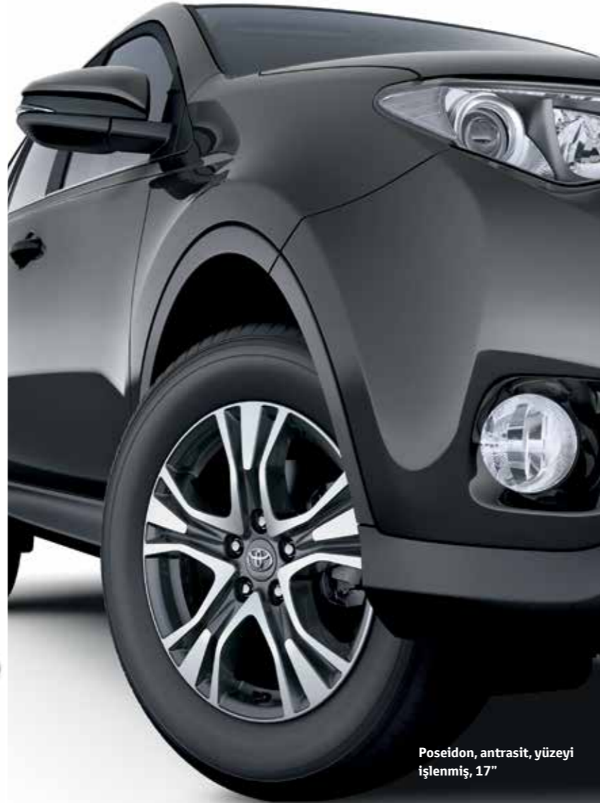
Poseidon, antrasit, yüzeyi işlenmiş, 17"