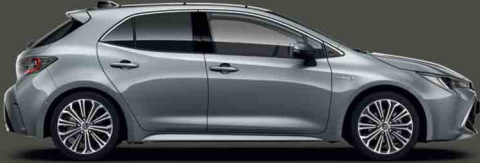
1H5 Milenyum Griş