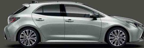
1F7 Gümüş Gri §