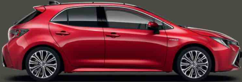
3U5 Egzotik Kırmızış