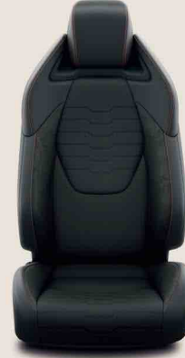
Siyah Deri/Kumaş (LA20)