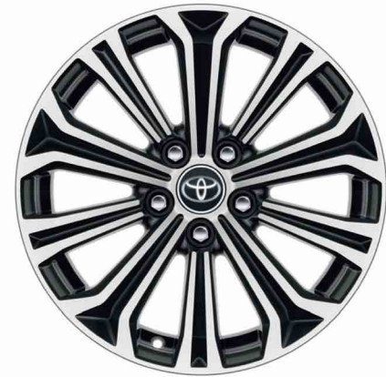
17" alüminyum alaşımli jantlar Flame X-Pack ve Passion X-Pack versiyonlarında standart