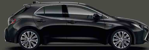
209 Siyah §