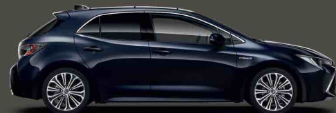
8X8 Safir Mavi §