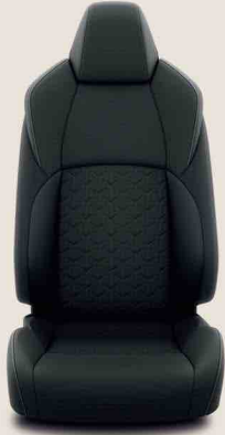
Siyah Kumaş (FB20)

Dream, Dream X-Pack, Flame, Flame X-Pack versiyonlarında standart