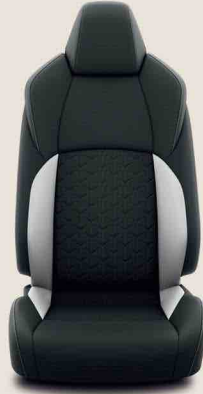
Gri-Siyah Kumaş (FB10)

Dream, Dream X-Pack, Flame, Flame X-Pack versiyonlarında standart