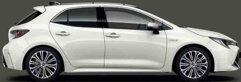
070 İnci Beyazı*