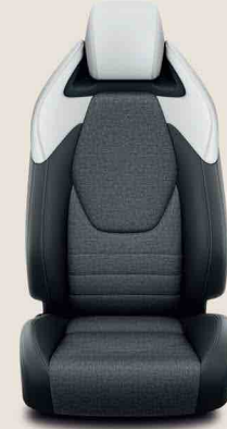
Gri Deri/ Kumaş (LB10)