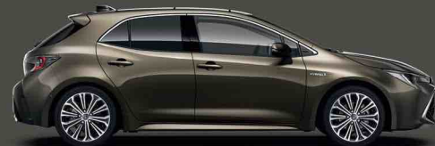
6X1 Güz Bronzu §