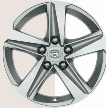
16" alüminyum alaşımli jantlar Dream, Dream X-Pack ve Flame versiyonlarında standart