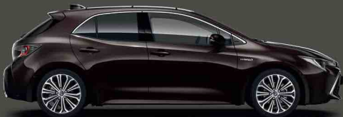
4W9 Moka Kahverengi §