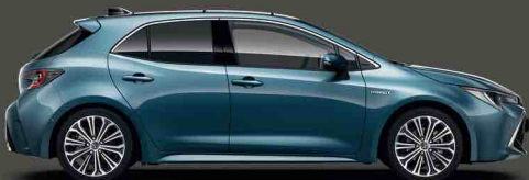
8U6 Denim Mavisi §