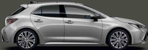
1J6 Kristal Gümüş Gri §