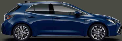
8Q4 Koyu Mavi