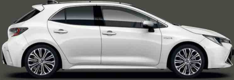
040 Kar Beyazı