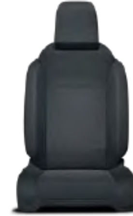
Gri Koltuk DöŐemesi