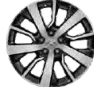
17" Alüminyum Alaşımli Jantlar