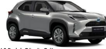
1L0 Parlak Gümüş Gri*