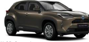
6X1 Güz Bronzu*