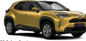
5C2 Sahra Sarı*