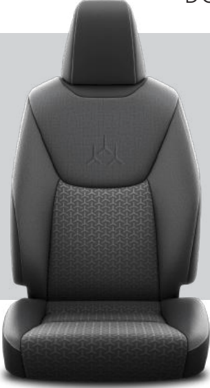
FB10 Kumaş Döşeme Dream, Dream X-Pack, Flame X-Pack