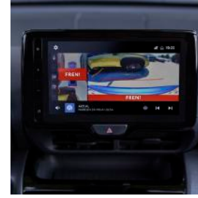
Geri Görüş Kamerası

Dinamik ve çok yönlü bir yaşam tarzına uyum sağlayan Yaris Cross Hybrid; Panoramik Cam Tavanı, 10" Ön Cama Yansıtılabilir Renkli Gösterge Ekranı, Kör Nokta Uyarı Sistemi, Geri Görüş Kamerası, Kendiliğinden Kararan Geri Görüş Aynası, Sürücü & Ön Yolcu Koltuk Isıtması ve Elektrikli Sürücü Bel Desteği gibi üstün donanımları ile güçlü teknolojisini her alanda hissettiriyor.