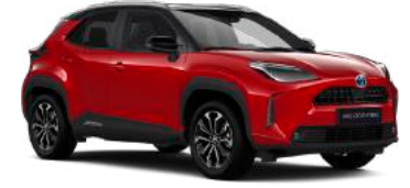
2SZ Egzotik Kırmızı§ / Siyah Tavan* Sadece Hybrid Passion X-Pack