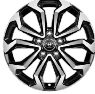
17" Alüminyum Alaşımli Jantlar Hybrid Passion X-Pack