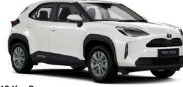
040 Kar Beyazı