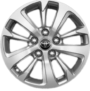
16" Alüminyum Jantlar Dream, Dream X-Pack, Flame X-Pack