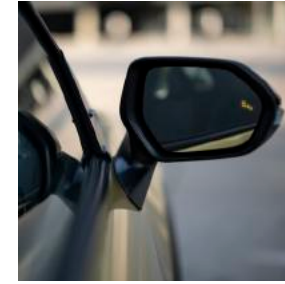
Kör Nokta Uyarı Sistemi