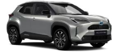
2VU Parlak Gümüş Gri* / Siyah Tavan* Sadece Hybrid Passion X-Pack