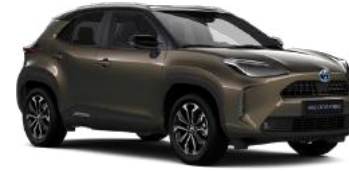
2TK Güz Bronzu* / Siyah Tavan* Sadece Hybrid Passion X-Pack