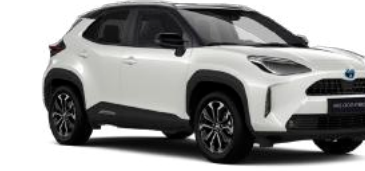
2PU Galaksi Beyaz§ / Siyah Tavan* Sadece Hybrid Passion X-Pack