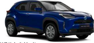
8W7 Kobalt Mavi*