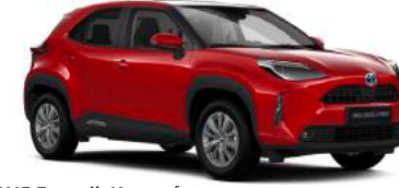
3U5 Egzotik Kırmızı§