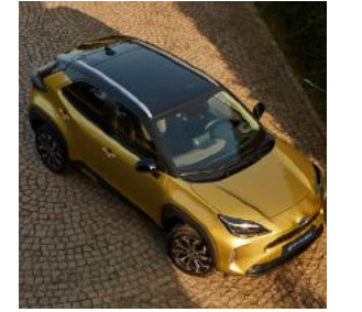
Panoramik Cam Tavan