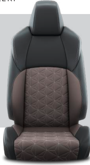
LA40 Deri/Kumaş Döşeme Hybrid Passion X-Pack

TOYOTA TÜRKİYE PAZARLAMA VE SATIŞ A.Ş. Cumhuriyet Mahallesi D100 Kuzey Yan Yol Caddesi No:5 Yakacık 34876 Kartal İstanbul Toyota İletişim Merkezi (0212) 354 03 54