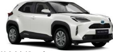
089 Galaksi Beyaz§