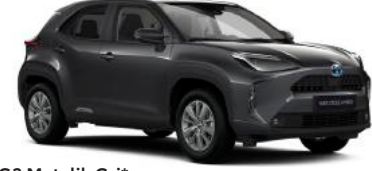
1G3 Metalik Gri*