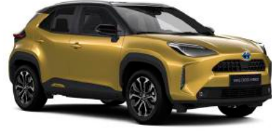
2V5 (5C2/202) Sahra Sarı* / Siyah* Sadece Hybrid Passion X-Pack