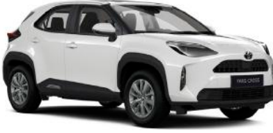
040 Kar Beyazı