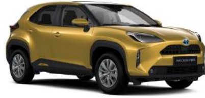
5C2 Sahra Sarı*