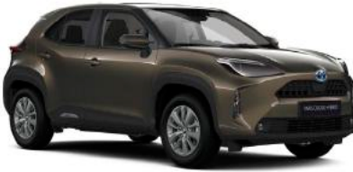
6X1 Güz Bronzu*