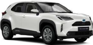
089 Galaksi Beyaz§