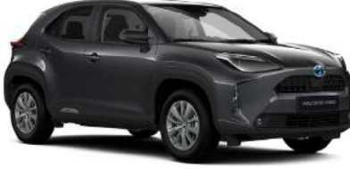
1G3 Metalik Gri*