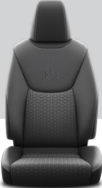
FB10 Kumaş Döşeme Dream, Dream X-Pack, Flame X-Pack