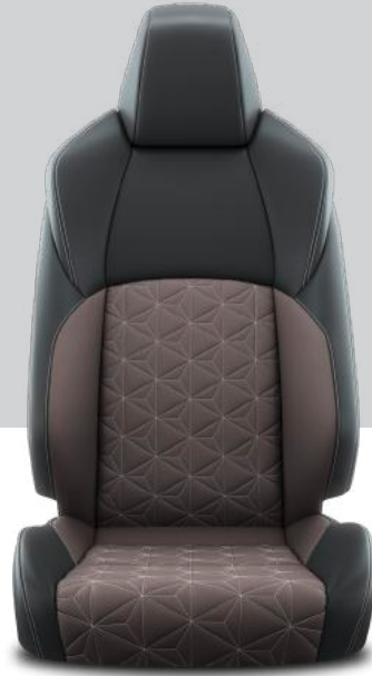
LA40 Deri/Kumaş Döşeme Hybrid Passion X-Pack

Toyota Türkiye Pazarlama ve Satış A.Ş.'nin, önceden belirtmeden satışa sürülen araçlarda model, teknik özellikler, donanım ve aksesuar değişikliği yapma hakkı saklıdır. Sipariş ya da sipariş edilen malı tanımlamak için kullanılan işaret ve rakamlardan herhangi bir hak iddia edilemez. Şekiller ve resimler seri üretim kapsamı dışında, standart olmayan ilave aksesuar ve donanımlar içerebilir ve/veya seçilen modele göre farklılıklar gösterebilir. İsteğe bağlı aksesuarlar ekstra ücrete tabidir. Baskı tekniğinden dolayı renk farklılıkları olabilir. Genel bilgi içeren bu doküman taahhüt ve sözleşme niteliğinde değildir. Bu dokümandaki araçların güncel özellikleri hakkında en yakın bayimize başvurabilirsiniz.