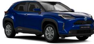
8W7 Kobalt Mavi*