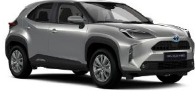
1L0 Parlak Gümüş Gri*