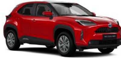
3U5 Egzotik Kırmızı§