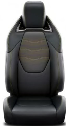
Amber Renk Dikişli Deri Spor Koltuk Hybrid Passion X-Style