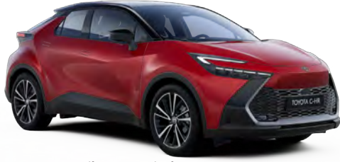
2TB Egzotik Kırmızı Siyah Tavan