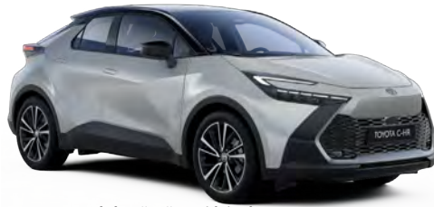
2VU Parlak Gümüş Gri/Siyah Tavan