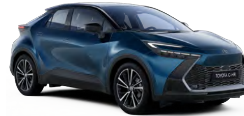
2YR Pasifik Mavi