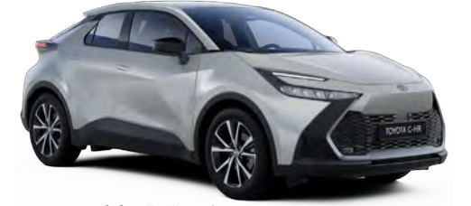
1L0 Parlak Gümüş Gri