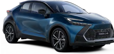
2YB Pasifik Mavi