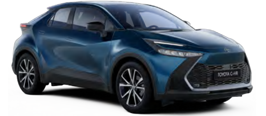
785 Pasifik Mavi