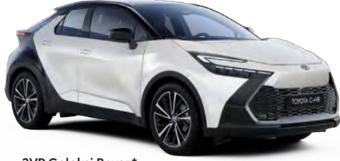
2VP Galaksi Beyaz*