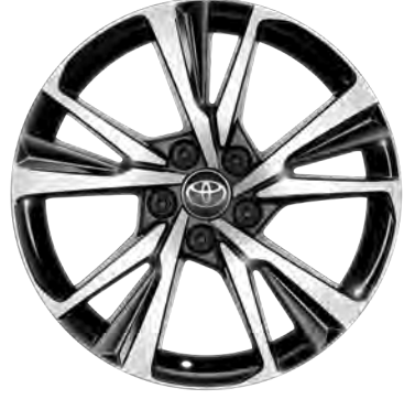
18" Alüminyum Alaşımli Jantlar Hybrid Passion