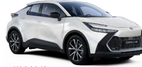
089 Galaksi Beyazı