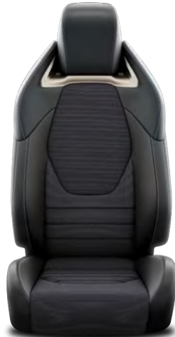
Vegan Deri / Kumaş Spor Koltuk Hybrid Passion X-Sport