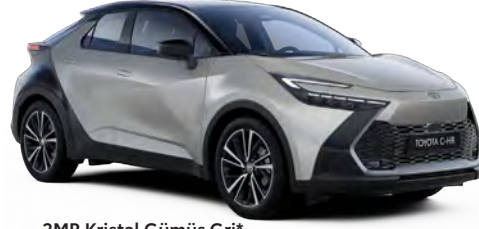
2MR Kristal Gümüş Gri*