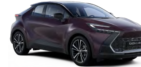
2XE Ametist Moru