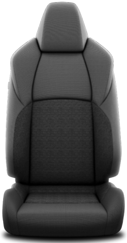
Kumaş Sportif Koltuk Hybrid Passion