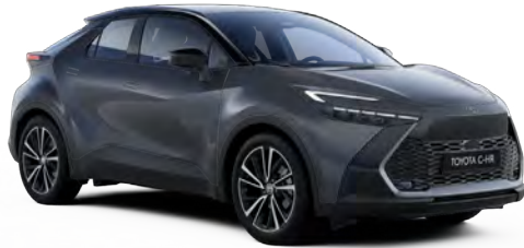
2NB Metalik Gri