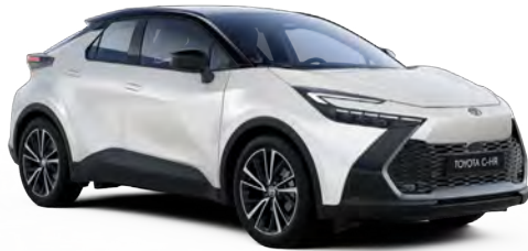
2YP Galaksi Beyaz