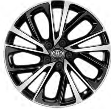
19" Alüminyum Alaşımli Jantlar Hybrid Passion X-Sport Hybrid Passion X-Style