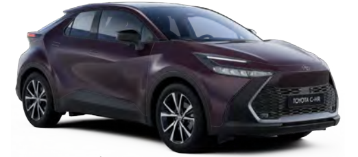
9AH Ametist Moru