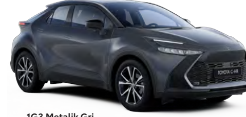
1G3 Metalik Gri