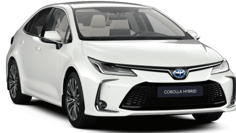
040 – Kar Beyazı