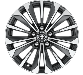
17" Alüminyum Alaşımli Jantlar