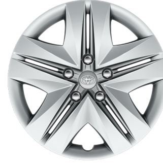
16" Çelik Jantlar ve Jant Kapakları