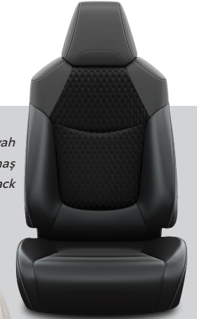
LA21 – Siyah Deri/Kumaş Passion X-Pack