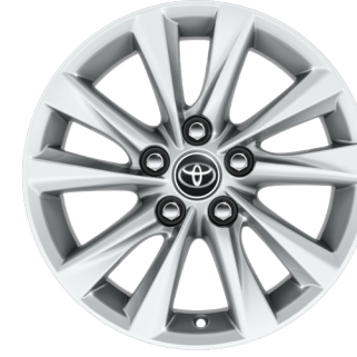
16" Alüminyum Alaşımli Jantlar