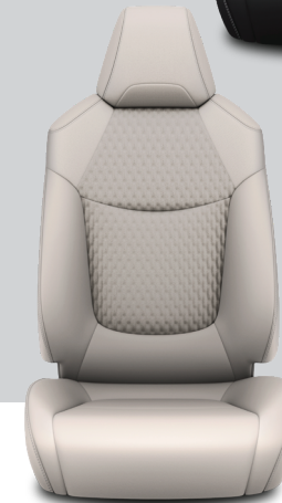
LA10 – Açık Gri Deri/Kumaş Passion X-Pack