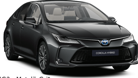
1G3 – Metalik Gri*