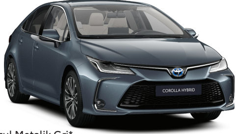
1K3 – Buzul Metalik Gri*