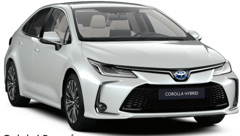
089 – Galaksi Beyaz §