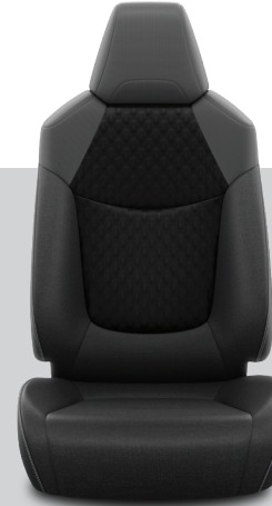
FB21 – Siyah Kumaş Vision Plus/Dream/ Dream X-Pack/ Flame X-Pack