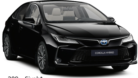
209 – Siyah*