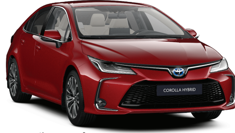
3U5 – Egzotik Kırmızı §