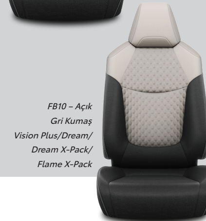
FB10 – Açık Gri Kumaş Vision Plus/Dream/ Dream X-Pack/ Flame X-Pack