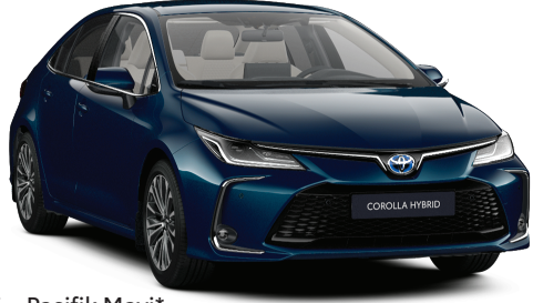
785 – Pasifik Mavi*