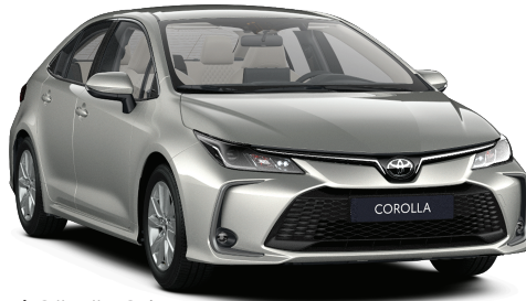
1J6 – Kristal Gümüş Gri*