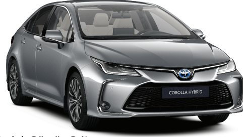
1L0 – Parlak Gümüş Gri*