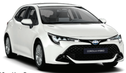
040 – Kar Beyazı