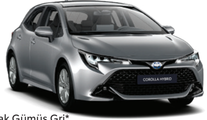
1L0 – Parlak Gümüş Gri*