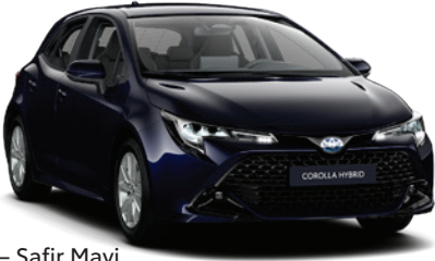
8X8 – Safir Mavi