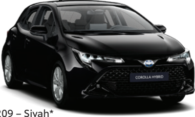
209 – Siyah*