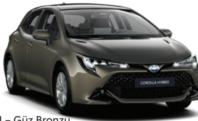
6X1 – Güz Bronzu