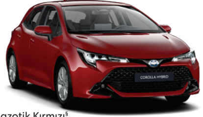
3U5 – Egzotik Kırmızı§