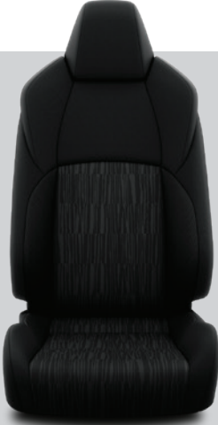
FB21 – Siyah Kumaş Flame