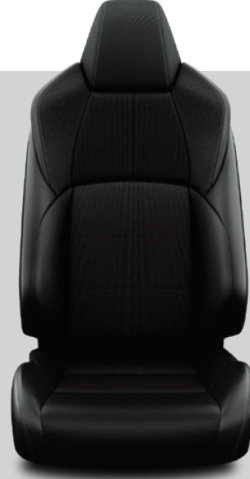
EA21 – Siyah Deri/Kumaş Passion X-Pack