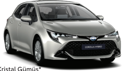
1J6 – Kristal Gümüş*