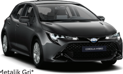
1G3 – Metalik Gri*