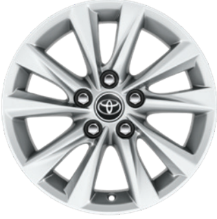
16" Alüminyum Alaşımli Jantlar