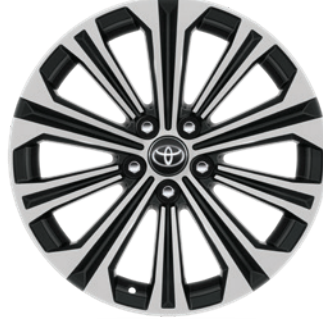
17" Alüminyum Alaşımli Jantlar