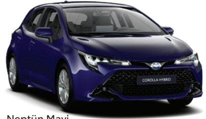
8Y8 – Neptün Mavi