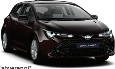
4W9 – Moka Kahverengi*