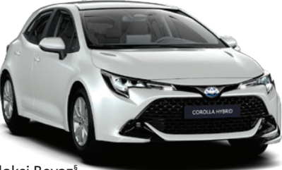
089 – Galaksi Beyaz§